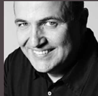
JAYME BERNARDO ARQUITETURA E DESIGN INTERIORES E ÁREAS COMUNS