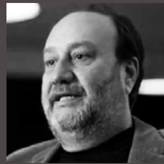
SMOLKA ARQUITETURA PROJETO ARQUITETÔNICO