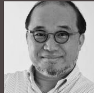
TAKEDA ARQUITETURA E PAISAGISMO PAISAGISMO